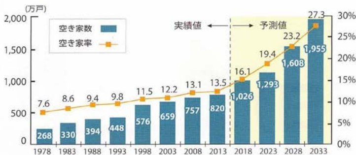
— 全国の空き家数・空き家率の推移 —