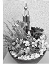
制作作品イメージ